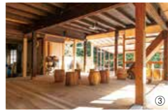
①ユニット名は共通の趣味である苔に由来。今でも二人で苔観察に行くそう ②大台ヶ原のナイトハイク。活動の一環として山歩きガイドも実施 ③木和田テラスの1階。広々とした空間は様々な用途に使える ④今後はキッチンも改修し飲食店誘致を構想中