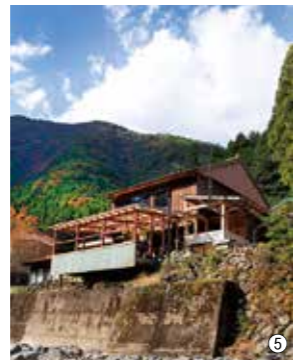
⑤川岸からスグの立地。夏は目の前の川で水遊びも楽しめる ⑥小椽川を望むテラスで川のせせらぎを聞きながらのんびり