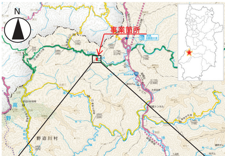
〔奈良県道路網図(R5JH506)を転載〕