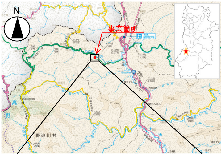
〔奈良県道路網図(R5JH506)を転載〕