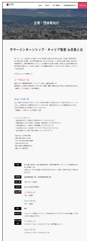
▲企業・団体等向けページ