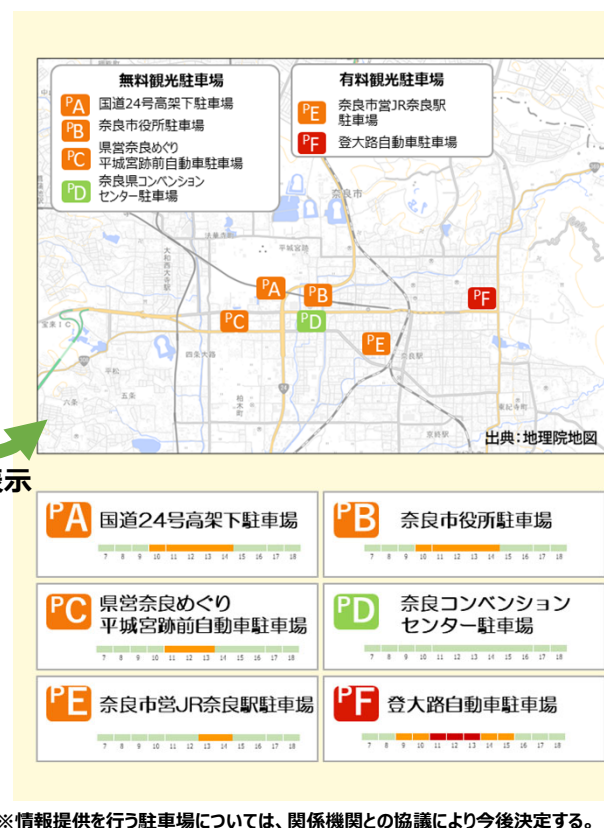
図. AIによる道路・駐車場混雑予報ページ（イメージ）