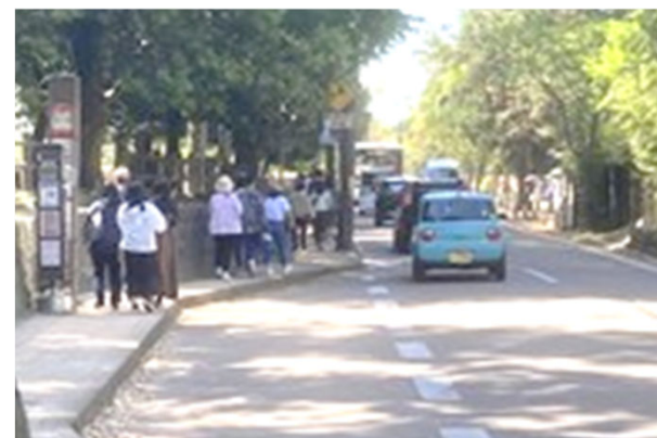
バス停留所付近における歩行者の滞留