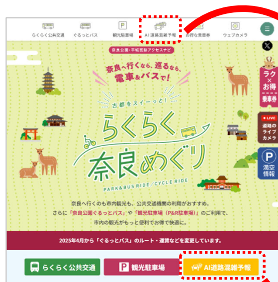
図. 奈良公園・平城宮跡アクセスナビ

○AIによる道路混雑予報に加えて、 AIによる駐車場混雑予報 を提供し、駐車場全体の利用率向上及び奈良公園内のうろつき交通の抑制を図る