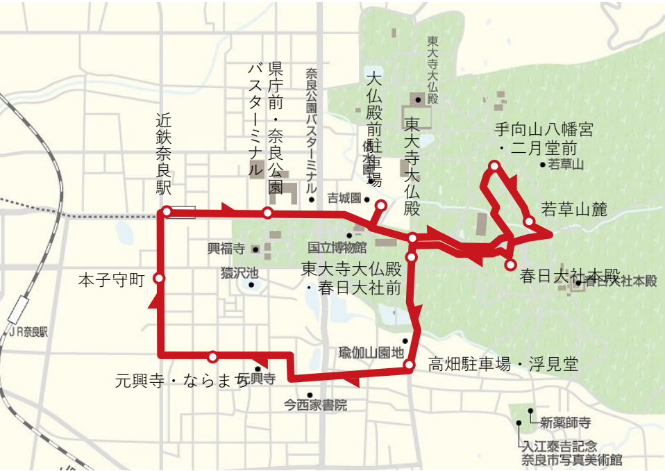
図. 奈良公園ぐるっとバスの運行ルート