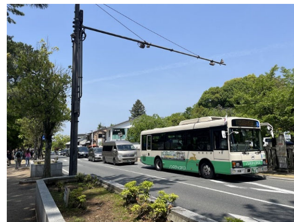
バスの停車による後続車両の滞留