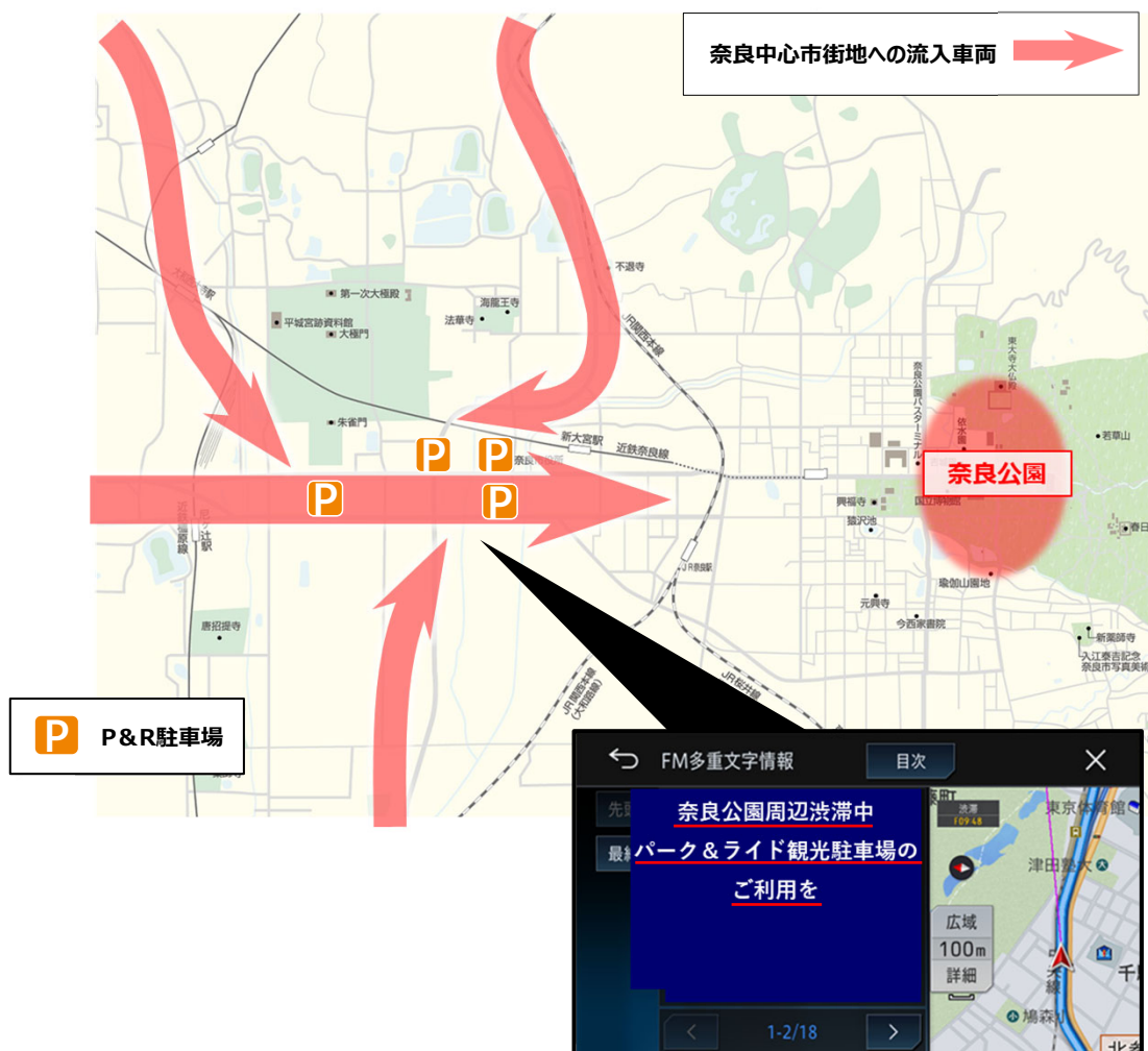
図. カーナビの表示画面（イメージ）