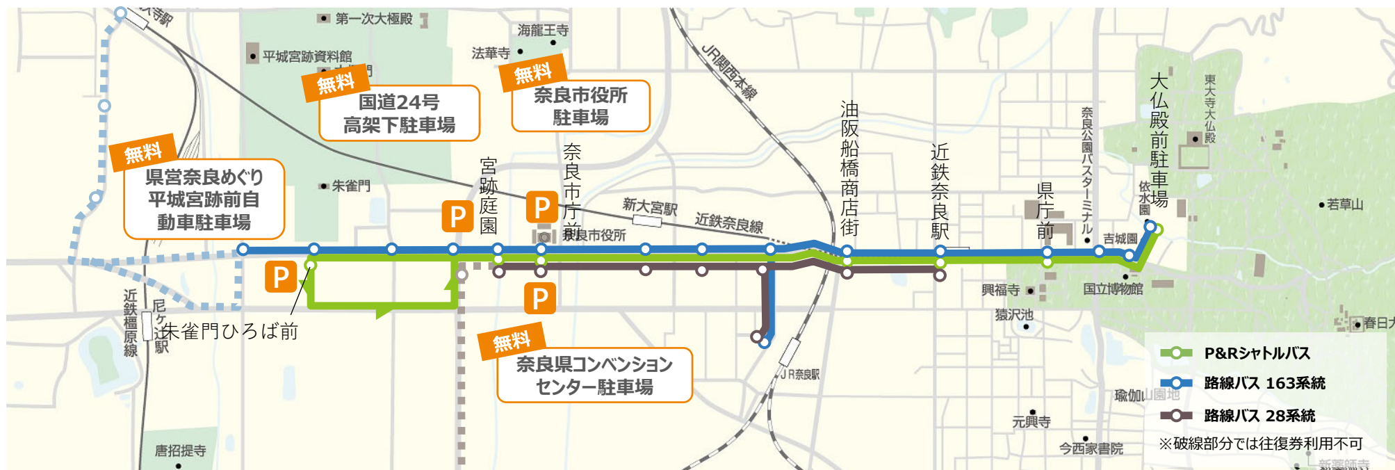
図. P&Rシャトルバスの運行ルート