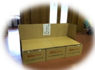
段ボールベッドの展示