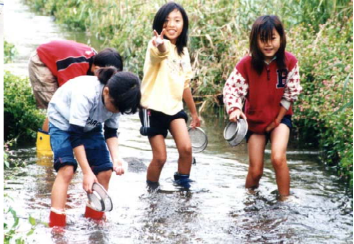
リバーウォッチング