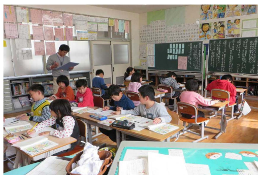
十津川村立西川第二小学校と田辺市立宮里小学校との交流学習

課題としては、事前の打合せの時間がとりにくいこと、活動に係る費用を捻出する必要があること、安全面の確保や移動に時間がかかることなどが考えられる。