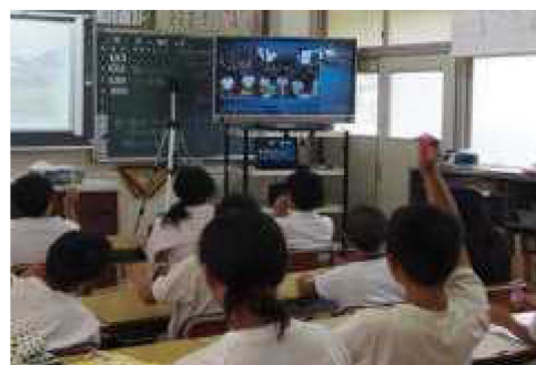
山添村立やまぞえ小学校と上北山村立上北山小学校におけるテレビ会議システムを活用した交流学習