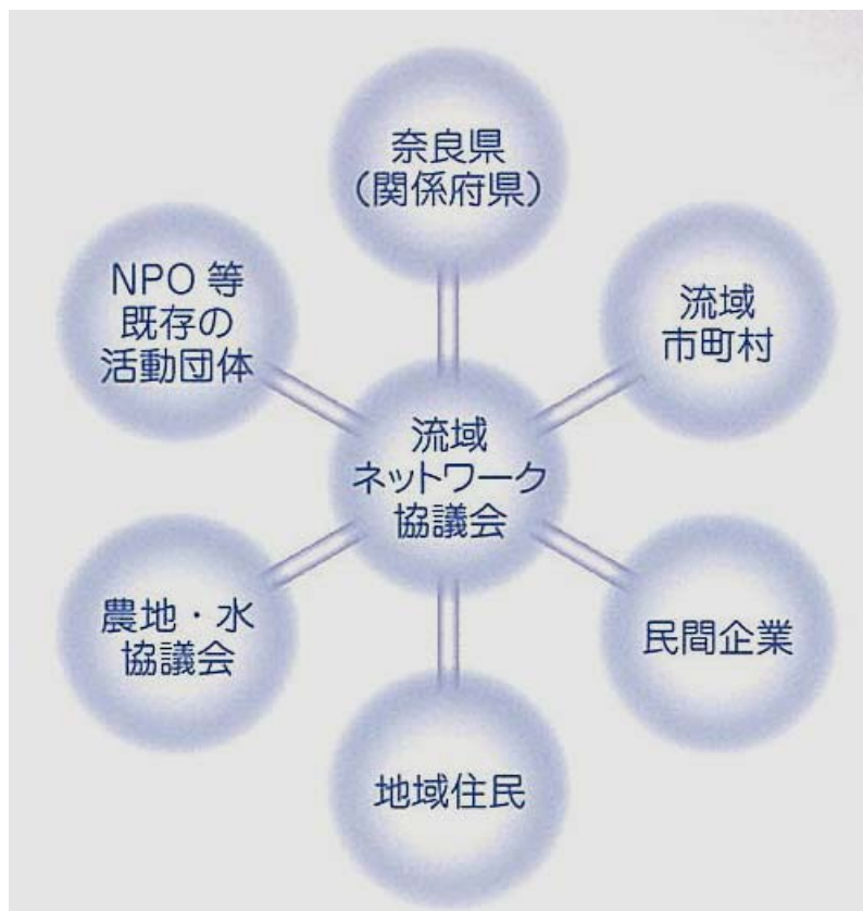
図 5.3.2 流域ネットワーク協議会の連携イメージ図