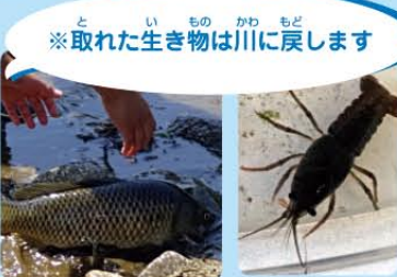
※取れた生き物は川に戻します

川にすむ生き物から、川のきれいさ（水質）がわかります。アメリカザリガニやコイはよごれた水にすむ生き物なんだよ。きれいな川にするためにみんなは何ができるかな？！