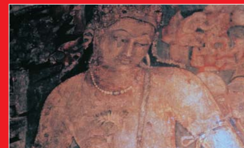
阿旃陀石窟寺院壁画（印度）