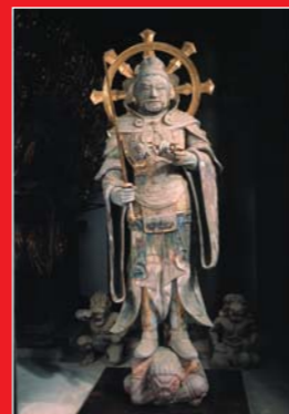
四天王像(持国天像)

当麻金堂内安放的是7世纪的干漆像。围绕着中央的本尊弥勒如来（7世纪的塑像），东北为多闻天，东南为持国天，西南为增长天，西北为广目天，共四尊天王。四天王像是仅次于法隆寺的日本第二古老的天王像。但是，增长天王像和广目天王像上后来的木雕修补比较显眼，多闻天王像则完全是后来的木雕像。持国天王像是其中最好地保持了当时形态的佛像。天王像的领子较高，肩膀处的布绕到头上，两袖长长垂下，据说这不是唐朝风格，而保留着唐朝之前的北周、北齐的服制。后来的修补也应该是在尊重原型的基础上进行的。这与之后制作的唐朝风格的四天王像不同，非常珍贵。