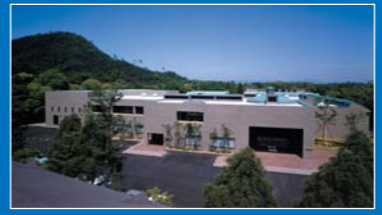
나라 현립 가시하라고고학연구소 부속 박물관

The Museum, Archaeological Institute of Kashihara, Nara Prefecture 奈良県立橿原考古学研究所附属博物館