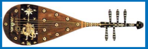
나전 자단 오펜 비파(소소인 보물)