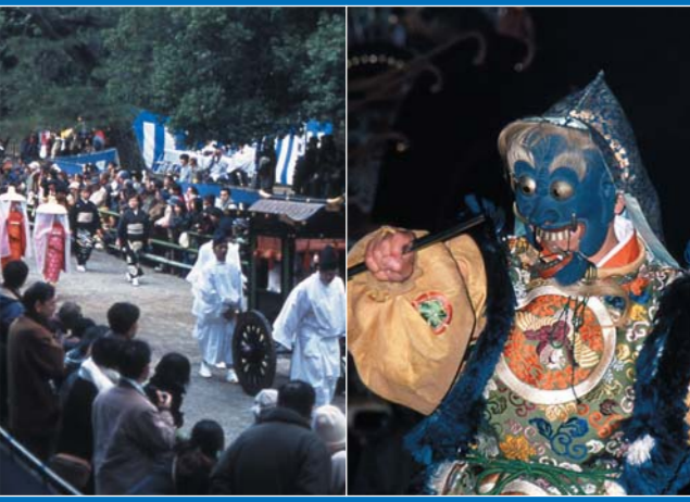
온마쓰리의 모습(오와타리시키) 나소리(아악)