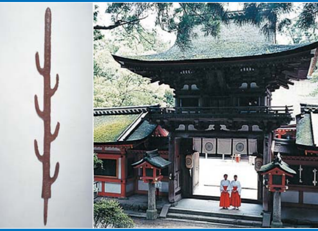
이소노카미 신궁 칠지도 이소노카미 신궁 경내