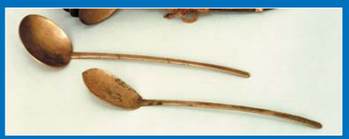
낫쇠 수저(소소인 보물)

소소(正倉)란 8세기 모든 관청과 각 사원에 설치되어 조세로 거둬들인 쌀과 재물을 수납한 창고를 말하며 현존하는 것은 도다이지 절에 속해 있던 소소 1동뿐입니다. 그렇기 때문에 소소인이라고 하면 이 건물을 말합니다. 소소인에 전해지는 보물은 756년부터 758년에 이르러 고묘 황태후가 도다이지 절 노사나 불상에 헌납한 보물류로 약 9,000점에 이릅니다. 소소인 보물의 특징은 품질이 우수하고 그 종류와 수량이 많을 뿐 아니라, 한반도와 중국 외에 페르시아 등으로부터 직접 전해진 물건들도 포함되어 있다는 점을 꼽을 수 있습니다. 또 의장이나 문양도 중국 대륙을 비롯하여 인도, 페르시아, 동로마 등으로 이어지는 외래적 요소가 진하고, 특히 서방 요소가 많이 가미되어 있습니다. 예를 들어 낫쇠 수저는 구리·납·주석의 합금으로 만들어진 금속제 수저로 사용되지 않은 채 전해진 것이며 한반도에서 직접 전해진 것으로 추정되고 있습니다. 소소인의 보물은 단순히 일본에 그치지 않고 모든 아시아의 문명들을 오늘에 전하는 것으로 세계 문화사적으로도 의미가 있습니다. 소소인 보물은 통상 공개하지 않으나 나라 국립박물관의 소소인전에서 매년 수십 점의 보물이 공개됩니다.