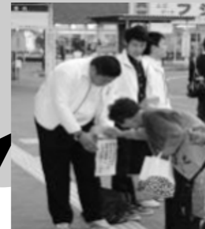
清掃ボランティアを行った生徒の感想

毎日使わせていただいている通学路や、学校周辺、なに感謝の思いをこめて、清掃活動を行っています。今後は、このような活動をさらに活性化させていき、地域の皆さんとの交流を深めていきたいと思っています。