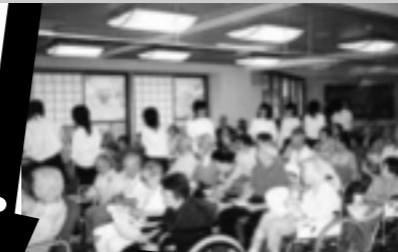
高齢者福祉施設訪問(特別活動)