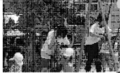
保育所訪問(特別活動)