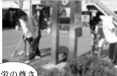
最寄りの駅周辺の清掃(特別活動)

○ボランティア活動などの豊かな体験活動の充実を図り、体験を通して生徒の内面に根ざした道徳性を育成し、人間としての在り方生き方についての自覚を深めます。