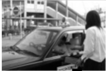
交通安全啓発活動(特別活動)