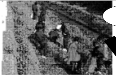
校区周辺の河川の清掃(特別活動)