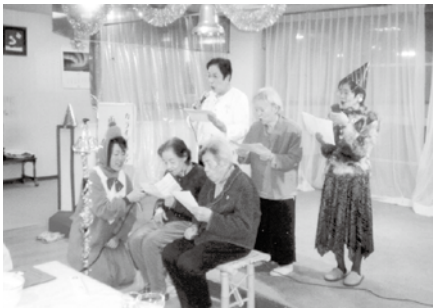
クリスマス会にて

働きやすい職場づくりに取り組むことで職場の雰囲気よくなることや、構成員みんなが同じ方向に向かっていくその一体感が出てくることだと思います。そうしたことによって問題があればすぐに話してもらえ、それに即応するような体制もできてきます。