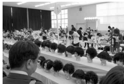
競技風景（美容職種）