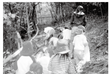
ドングリ拾いにて

管理職と言えどもできる限り情報を抱え込まず、構成員みんなで相談しあうコミュニケーションやチームワークが大事だと思います。