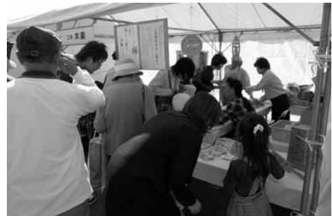
【吉野杉すかし彫り実演・販売】

技と匠エリアである第二体育館では、イベントコーナーが設置され、日本料理、フラワー、お菓子づくりの実演や子供技能グランプリが行われ、親子で楽しむ姿も見られました。また、周りの各ブースでは、美容学生さんによるネイルアートや出店団体の物販等にたくさん足を運んでいただきました。