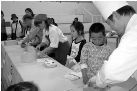
【洋菓子づくり体験】

ふれあいエリアである北駐車場では、万華鏡づくりやカンナ削り、わら細工など技能者の技の実演や体験できるコーナーが設置され、熟練した技能者の指導のもと、ものづくり体験を楽しむことができました。