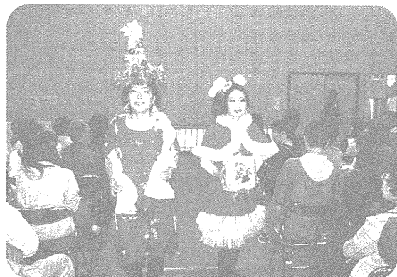
学生による美容ショー

その他、作品の展示や即売も行われ、「技能」に親しむことができた2日間となりました。