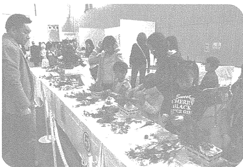
子ども技能グランプリ・フラワーアレンジメント

技と匠エリアである第二体育館では、イベントコーナーが設置され、日本料理の実演、フラワー装飾やお菓子づくりの子供技能グランプリが行われ、親子で楽しむ姿も見られました。また今年度は学生による華やかな美容ショーも催されました。周りの各ブースでは、美容学生さんによるヘアメイクや出店団体の物販等にたくさん足を運んでいただきました。