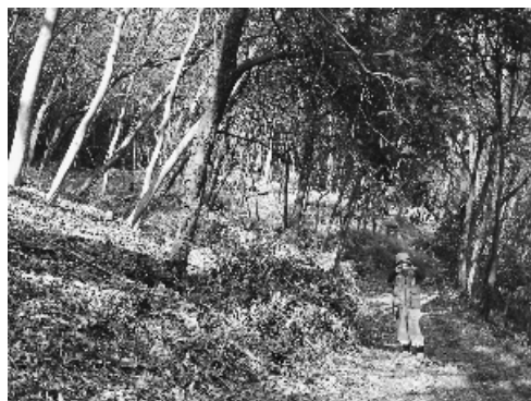
整備されて明るくなった里山林