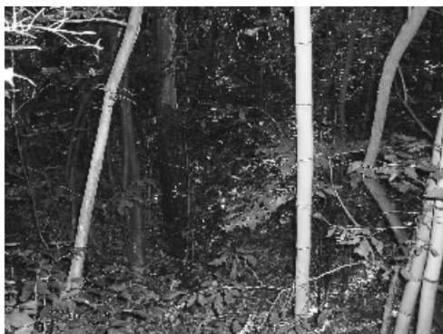
実施前の鬱蒼とした里山林

す。今後も、地元とボランティア団体とが良好な関係を築きながら、この事業を通して、ボランティア団体の方々だけでなく何らかの形で、地元の方々を巻き込んで展開していくように実施していきます。