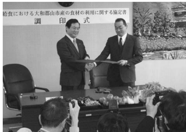
「食材の利用に関する協定書」調印式

生徒や保護者に「給食だより」や校内放送等で地元産野菜の使用などについて紹介されています。今後、双方が品目の希望を出し合い、1回の品目数を増やしていくことをめざしています。