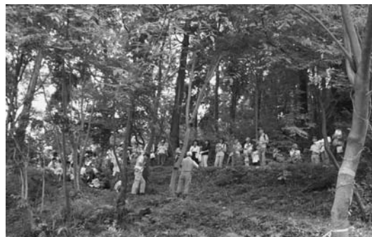
里山林と竹林についての講義(森の学校)