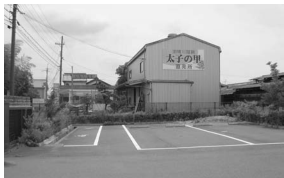
斑鳩旬菜果 太子の里

「斑鳩旬菜果 太子の里」では、直売部会に参加している生産者が作った野菜や果物が販売されており、地域住民との交流の場になっています。