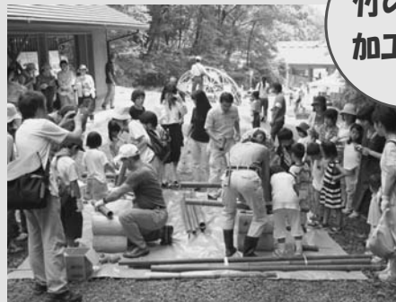
竹の利用加工体験