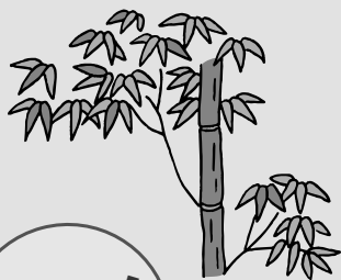
バームクーヘンづくり

参加者は70名で親子連れが多く、バームクーヘンづくりの合間には他のコーナーを回り、梅雨の晴れ間が広がる週末を楽しく過ごしていました。