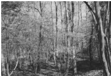
整備された里山林