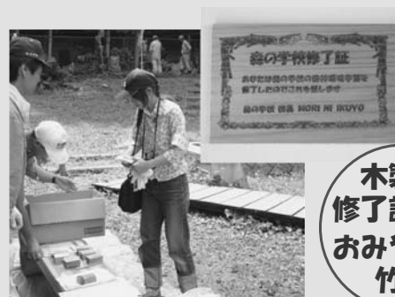
木製の修了証書とおみやげの竹炭