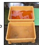
推奨される踏込消毒槽の設置方法！