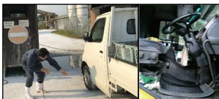
車両はタイヤだけでなく、 泥よけの内側まで消毒 し、 フロアマットの交換やペダル等車内も消毒