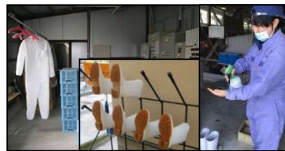
専用の服や靴の使用、手指消毒