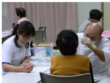
永長先生による健診・指導

今回は、雪が降る寒い中での実施となりましたが、参加された方々はほとんど、受診された後も、講演開始の時間まで残っていただき、熱心に先生の講話を聴いておられました。