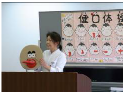
「結んで開いて」のメロディに合わせた「健口体操」

栄養指導では、「しっかり食べて元気に長生き」という配付パンフレットに沿って、高齢者に多いとされる「低栄養」の予防などについて、講師（栄養士）からお話をさせていただきました。ひと口に「低栄養」といっても、皆さんそれぞれの食生活は様々。そこで、自分自身の普段の食生活についてパンフレットの中にある「栄養調査表」で振り返っていただきながら、該当項目をチェックして、高齢者に不足しがちな、あるいは、多く摂取しがちな食品などについて分かりやすくお話をさせていただきました。