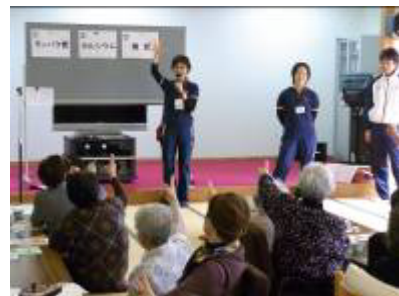
講話の前の脳トレで頭のウォーミングアップ

健康長寿のために「いつまでも楽しくおいしく食べること」は何よりも大切。そこで、食生活に欠かすことのできない要素である「栄養」と「口腔」を合わせて指導いただくことで、より一層の相乗効果が生まれることを期待したいと思います。