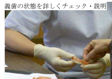
義歯の状態を詳しくチェック・説明

このような状態を改善するきっかけとなるのは、やはり集団的指導だけでは不十分で、個別指導の重要性を改めて知ることとなりました。