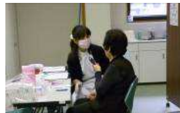
歯科衛生士のキメ細かい指導

今回は、「へき地巡回検診（眼科、耳鼻科）」に来た方も、村の職員の方の熱心に勧誘いただき、最終的に15名の方が歯科健診を受診されました。歯科健診は苦手だという方もおられましたが、健診後に「また来年も来てね。」と声をかけていただき、大変嬉しく思いました。