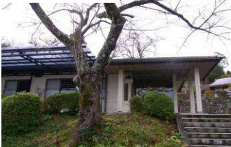
高原多目的集会所