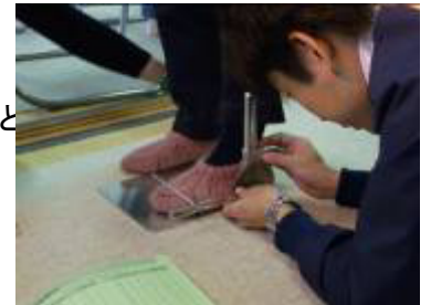
足首挙上(爪先があがる)角度の測定

TEL:0744-29-8641 FAX:0744-29-8433 Eメール: jikko@nara-kouiki.jp