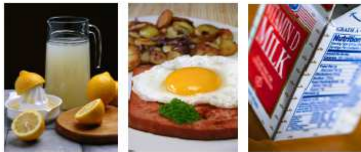
当日展示 & 配付した資料の一部