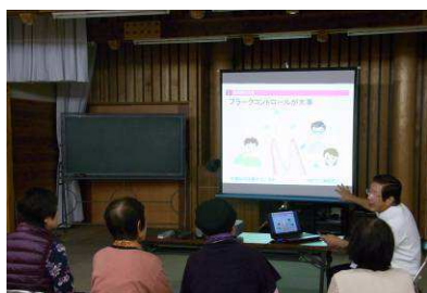
スライドを使ったわかりやすい講話