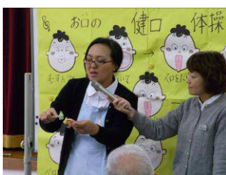
義歯のお手入れ指導

また、「低栄養」の予防には、食品数を増やして副食(おかず)から食べるとともに、糖質や塩分は控えめにするなど、栄養バランスのとれた食事を「1日3食」しっかりとることなどが大切なことでした。