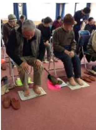
新聞紙を使った足指運動

今回は、五條市が実施した「日常生活圏域高齢者ニーズ調査 * 」の結果と厚生労働省モデル事業地区内の調査結果との比較分析等により、同市の介護予防施策等の今後の課題として浮かび上がった「転倒予防対策の充実・強化」の一環として、市担当者との相談しながら「転倒予防」に焦点を当てた指導・普及啓発を実施することとなりました。