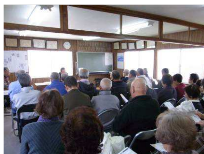
会場は満員の盛況！

レジュメやパンフレットを活用して大変わかりやすく説明いただきました。また、良好な口腔状態を保つためには、歯磨きだけでは取れない歯石除去など、虫歯（歯痛）の時だけでなく定期的に歯科健診を受けることが必要であるとともに、日常生活の中でできる簡単な口腔体操や義歯の手入れなど、高齢期における口腔ケアが、誤嚥性肺炎などの発症する確率をかなり低下させる効果につながることにしても、参加者に熱心に語りかけておられたのが印象的でした。