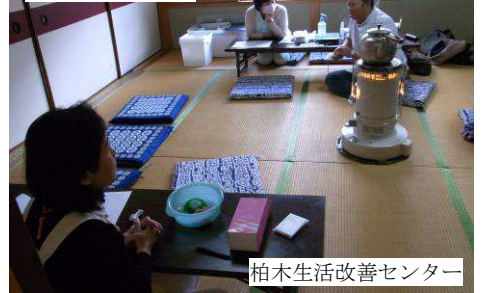
柏木生活改善センター