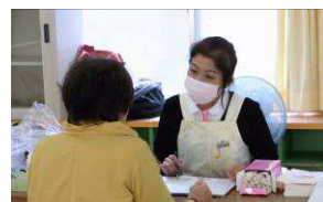
歯科衛生士による個別指導

歯科医師、歯科衛生士、川上村の職員の方々のおかげで無事初日を終えることができました。より良い事業となるよう、最終日まで頑張っていきたいと思っております。