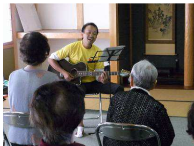
馴染み深い歌で「つかみ」はOK

今回は、2時間(休憩あり)のプログラムでしたが、参加者(13名:平均年齢78歳)の方々には、最後まで熱心に・楽しく取り組んでいただき、当日実施したアンケート(回収率100%)では、全員が「本日のプログラムを家で継続できる」と回答されていました。