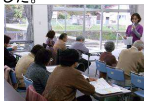
語り掛けるような栄養指導

栄養と口腔という二つの分野のプログラムでしたが、改めて、栄養と口腔に関する密接な関連性とそれぞれの重要性が理解いただける事業となったと思います。休憩中や終了後の歓談の中でも、村担当者も含め各専門家の方々が熱心に意見交換されていたのが印象的でした。