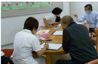
川上総合センターデイルーム