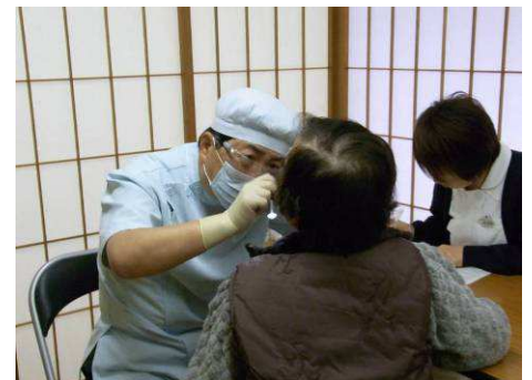
岸本先生による健診・指導