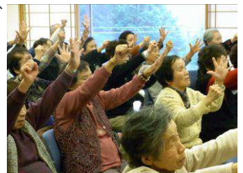
ジャンケンを使った楽しい脳トレ

運動指導の後、「ありがとう」と笑顔で遠足に向かわれる参加者のみなさんの笑顔が印象的な事業となりました。