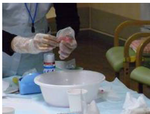
染め出し検査で義歯ケアのチェック