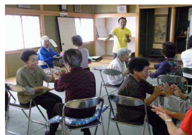
ペアになって手指運動

歌いながら体操を行うことは、楽しく実践できるということと同時に、口腔の運動にもなる効果があるということです。