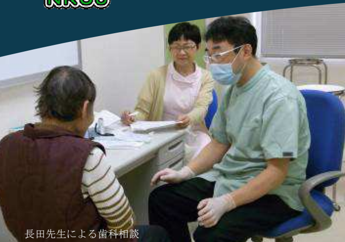
長田先生による歯科相談