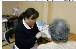
歯科衛生士による個別指導

御所市内には多くの歯科医院があるとのことで、日頃から歯科医院に通われている方も多かったのですが、義歯の状態やかみ合わせなど、高齢者専用の健診項目や口腔指導を受けていただくことで、改めて個々の口腔状態を知っていただき、より良い口腔ケアを実施していただく良い機会となりました。