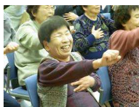
みなさんの笑顔が印象的でした