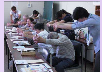
栄養指導の後は、ストレッチ運動等を実施