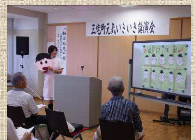
「健口体操」にチャレンジ