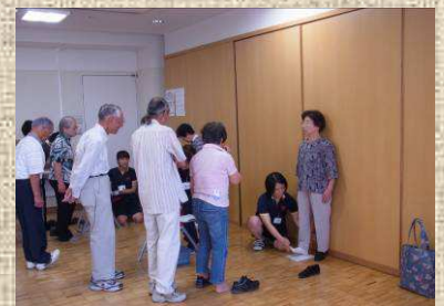
転倒リスクに関係する足関節角度をチェック