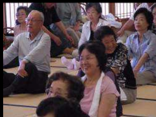
約1時間、最後まで楽しく！熱心に！