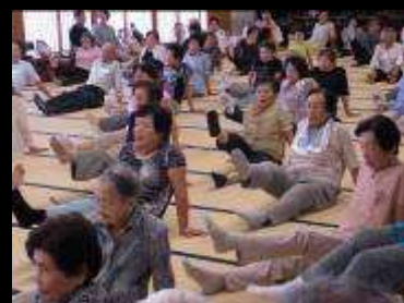
転倒予防につながる太もも上げ運動