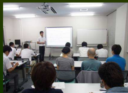
ミーティングは初回から内容盛りだくさん！