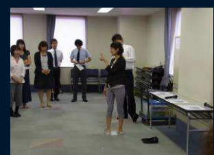
足首関節角度測定 デモンストレーション (実演・説明:(株)ルネサンス)