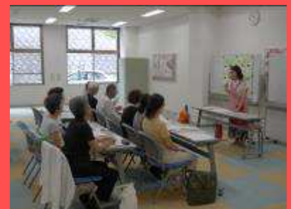
熱心に耳を傾ける参加者の方々