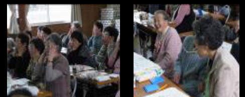
楽しい実践指導のようす