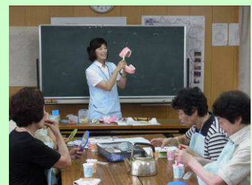
染色液を使用して「磨き残し」をチェック