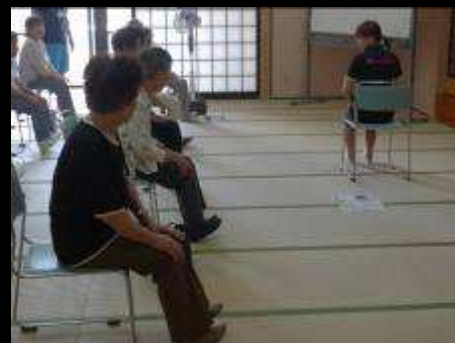
柔軟性アップのための「つま先・かかと上げ運動」