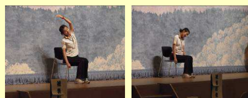
肩こり予防のためのストレッチ運動