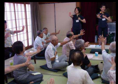
まずは脳トレで頭の体操