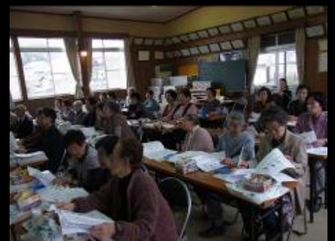
皆さん熱心に耳を傾けておられました