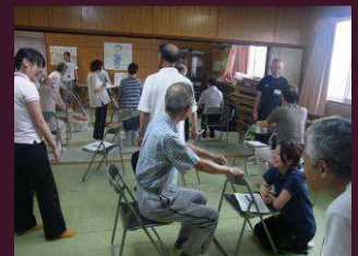
② 30秒椅子立ち上がりテスト