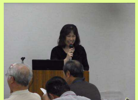
参加者に語りかけることで一体感のある講義に