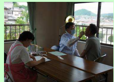
講演後、希望者には歯科健診も!