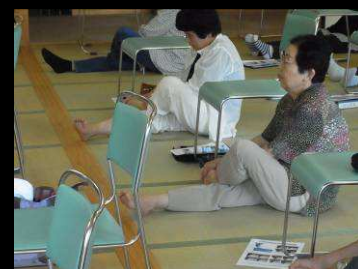
お風呂でもできるマッサージ(足首まわし)