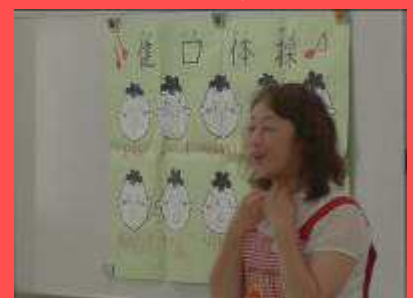
唾液腺マッサージ指導