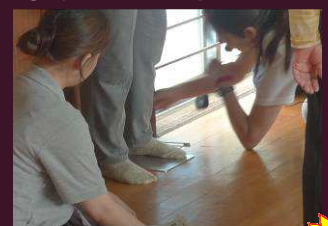
④ 足首関節角度測定