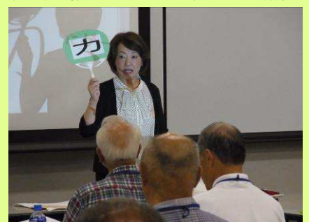
大きな声で「パ」「タ」「カ」発声にチャレンジ