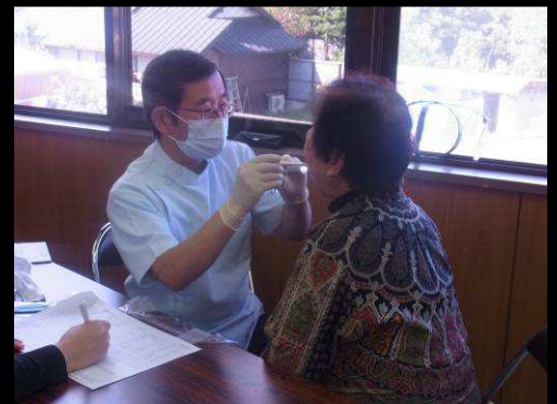
西川先生による歯科健診・指導