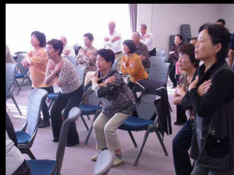
ハーフスクワットで下半身の筋力UP