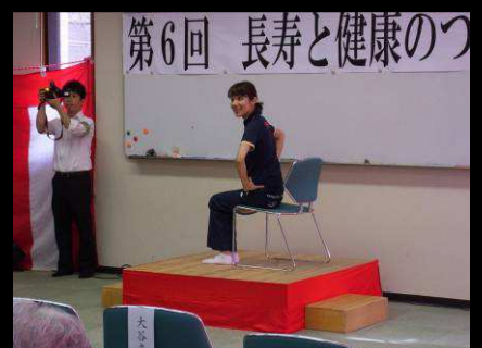
足腰のストレッチ