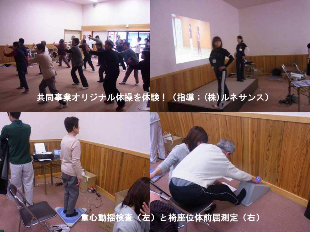
共同事業オリジナル体操を体験！（指導：(株)ルネサンス）