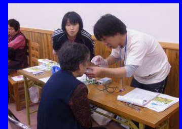
口唇閉鎖力の測定