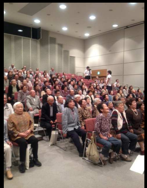
肩こり予防ストレッチにチャレンジ