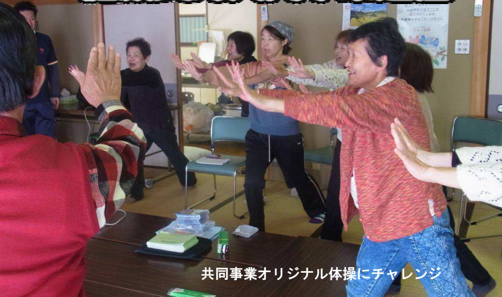
共同事業オリジナル体操にチャレンジ