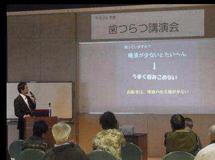
午後には「歯つらつ講演会」を開催