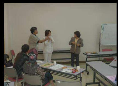
講演後も熱心に質問&意見交換