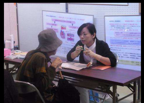
口腔ケア等について歯科相談