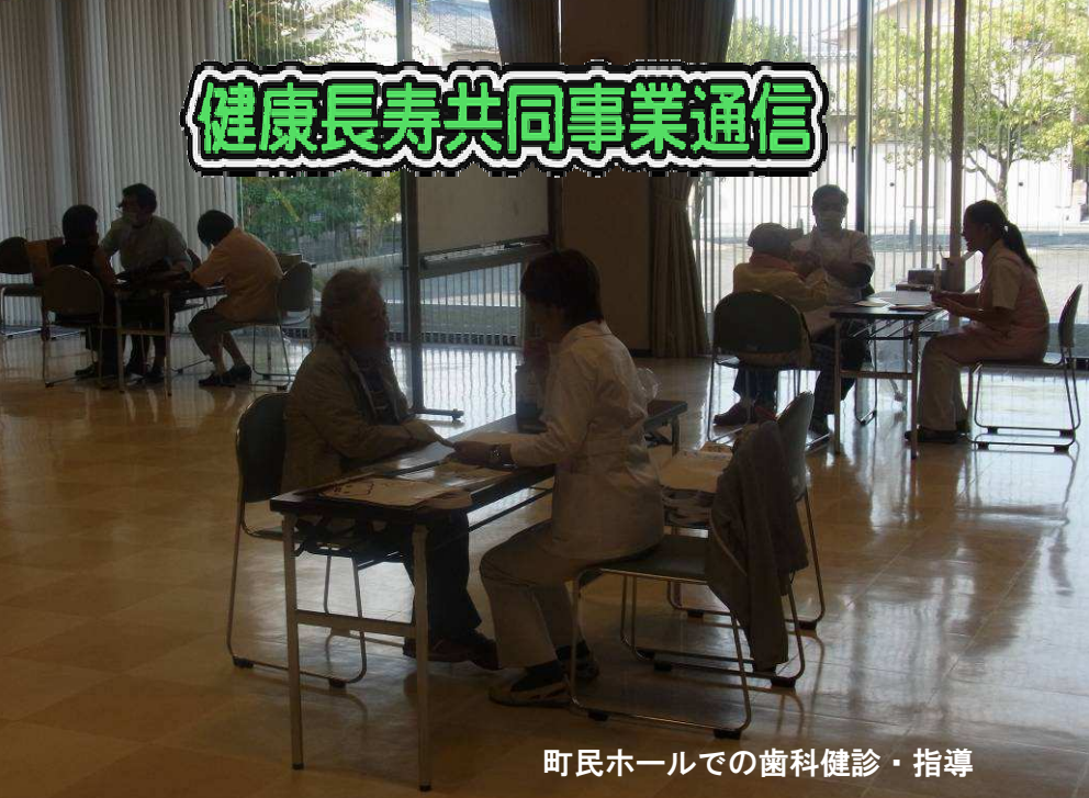
町民ホールでの歯科健診・指導