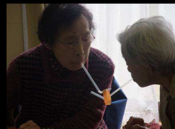
口唇の筋力UPに役立つ ストローを使った輪ゴムリレー