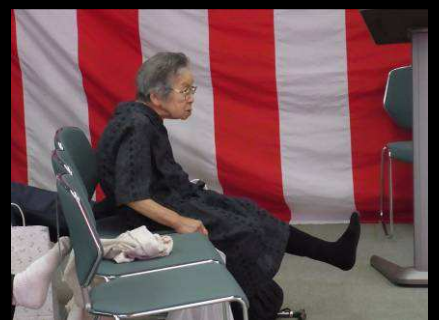
足の筋力アップ体操