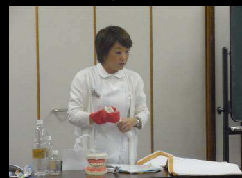
“嚥下のしくみ”について説明