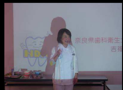
まずは、講師が手話で自己紹介!