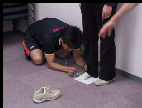
転倒リスクに関係する足首関節角度測定