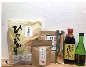
奈良まほろば餃子セレクト ～おうちで奈良を体験セット～