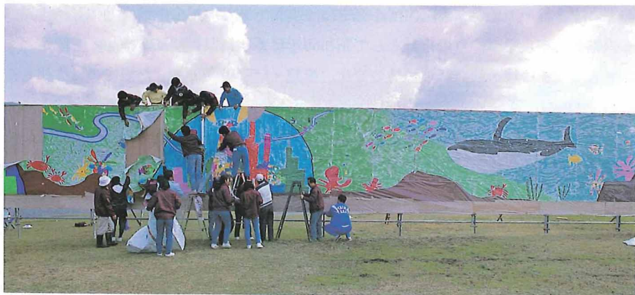
巨大アート 「遊」のある奈良県100選写真

奈良県では世界に開かれた国際文化観光・平和県として、近く策定されます「奈良県新総合計画」に沿い諸施策を積極的に行っていきます。第二阪奈有料道路や京奈和自動車道等の幹線道路網の整備、リニア中央新幹線建設促進をはじめとする交通機関等の整備など、21世紀に羽ばたく奈良県の基盤づくりに取り組んでいます。そして、生きがいと誇りの持てる長寿社会の実現に向けて、医療・福祉に携わる人材養成、女性・青少年対策等視野の広い、明るく、たくましい人づくりを推進し、本県の特徴である豊かな歴史文化や自然環境等を十分活かした地域の振興を図るなど、「遊」のある奈良県づくりを目指しています。