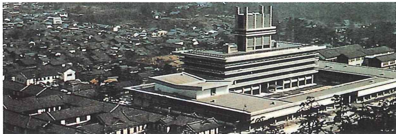
新旧県庁舎（昭和40年）

明治22年4月1日の町村制施行当時、10町142村2組合村で、人口は50万人ほどでした。その後県勢の発展にともない、昭和30年前後に市町村合併が促進され、現在は、10市20町17村で、人口は約142万人となっています。