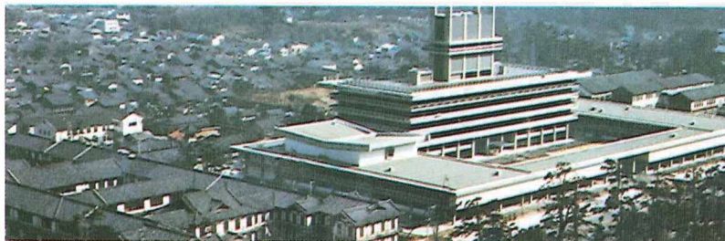
新旧県庁舎（昭和40年）

明治22年4月1日の町村制施行当時、10町142村2組合村で、人口は50万人ほどでした。その後県勢の発展にともない昭和30年前後に、市町村合併が促進され、現在は、10市20町17村で、人口は約140万人となっています。