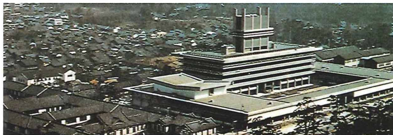
新旧県庁舎（昭和40年）

明治22年4月1日の町村制施行当時、10町142村2組合村で、人口は50万人ほどでした。その後県勢の発展にともない昭和30年前後に、市町村合併が促進され、現在は、10市20町17村で、人口は約141万人となっています。