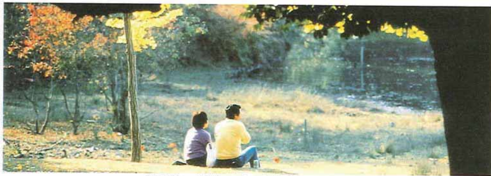
秋の陽 「遊」のある奈良県100選写真

奈良県は、これから21世紀にかけて、人間性への回帰や自然志向の高まり、また多彩な交流が一層強く意識される中で、新しい世紀に力強く羽ばたく素晴らしい可能性に満ちています。昨年策定された奈良県新総合計画では、「世界に光る奈良県づくり」を基本目標とし、歴史、文化、自然といった本県の優れた特性を最大限に生かし、より大きな新たな魅力を創造して新しい時代にふさわしい個性と魅力に満ち、内外から注目されるような存在感のある地域となることをめざしています。今後その実現に向けて、県土の基盤整備、医療福祉、産業振興、国際文化観光、生活環境、人材育成、地域整備など各分野の施策を積極的に推進していきます。