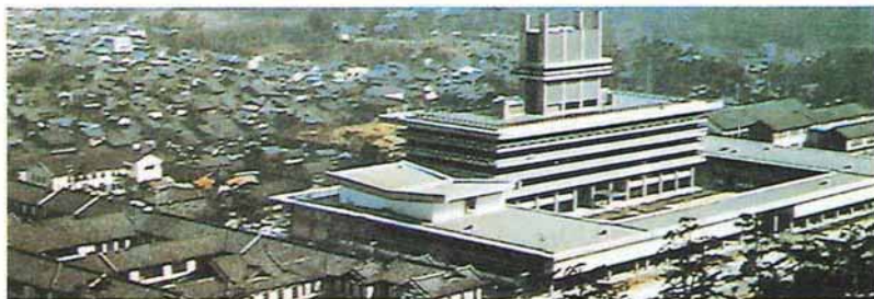
新旧県庁舎（昭和40年）

明治22年4月1日の町村制施行当時、10町142村2組合村で、人口は50万人ほどでした。その後県勢の発展にともない、昭和30年前後に市町村合併が促進され、現在は、10市20町17村で、人口は約143万人となっています。