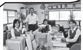
なごやかな雰囲気職場