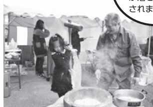
年末恒例のもちつき大会の様子

そして、「奈良日化サービスで働いてよかった!」「奈良日化サービスでぜひ働きたい!!」と言われる会社を目指していきたいと思っています。