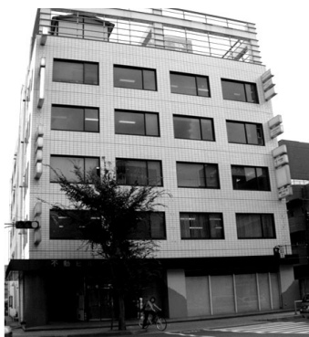
入居しているビル