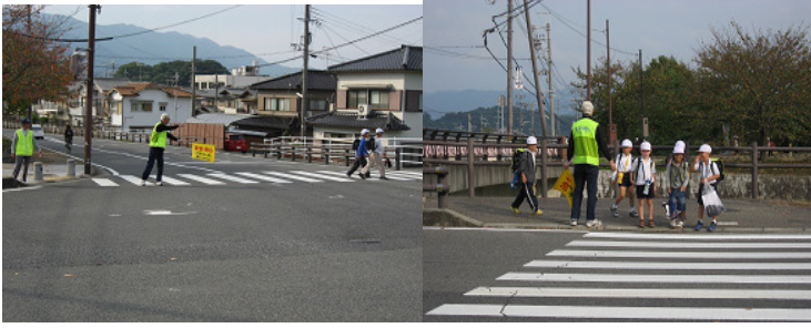
【見守りたいの活動の様子】

児童の下校時間に合わせて見守りたいの方々が交差点や四つ角に立って見守り活動を行ってくれています。最初恥ずかしがっていた児童も元気よく挨拶ができるようになりました。