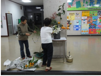
生け花ボランティア 11月