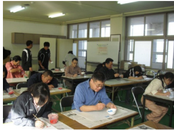
学校スローガン作り 11月