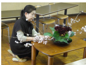
生け花ボランティア 4月

学校の環境整備のためにPTAボランティアや地域の方に、花壇の整備活動・廊下などへの生け花・ペンキ塗りなどの補修作業・自転車業界の方による自転車の点検・図書室の整理活動など年間を通じて行っていただいています。特に図書の整理ではコーディネーターを中心に、ボランティアを募り年間を通じて行っていきます。また、菜の花の植樹では、他市で行われている菜の花プロジェクトのボランティアの方の協力により、間引きした苗をいただいております。