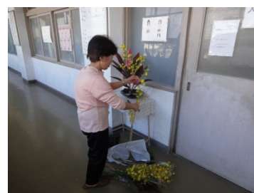
生け花ボランティア 10月