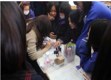
ネイルアーティスト

キャリア教育の一つとして本校ではゲストティチャーを20人ほど招き、職業についての話を聞かせていただいている。ボランティアで来ていただいています。ゲストティチャーを招くにも、学校ボランティアの協力により進められています。