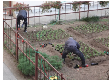
中庭花壇の整備 12月