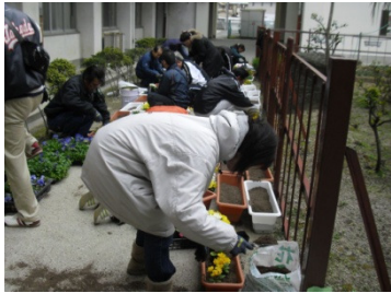
プランター作り 2月