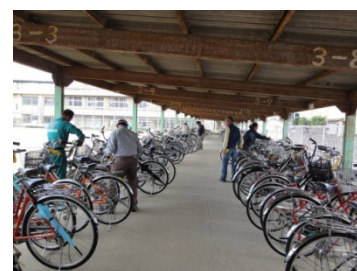
通学自転車の点検 10月