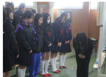
デパートの接客について