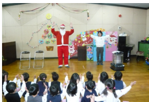
英語をしゃべる サンタ