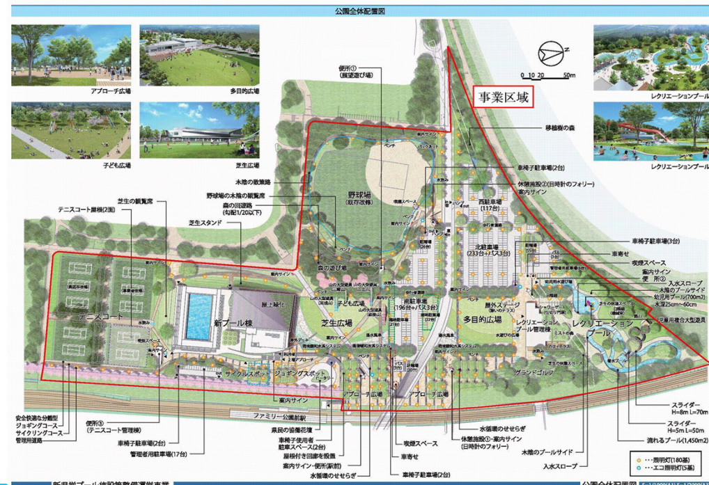
新県営プール施設整備運営事業 公園全体配置図 5=1/1000A(1.5~1.2000A)