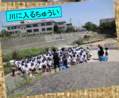
川に入るちゅうい