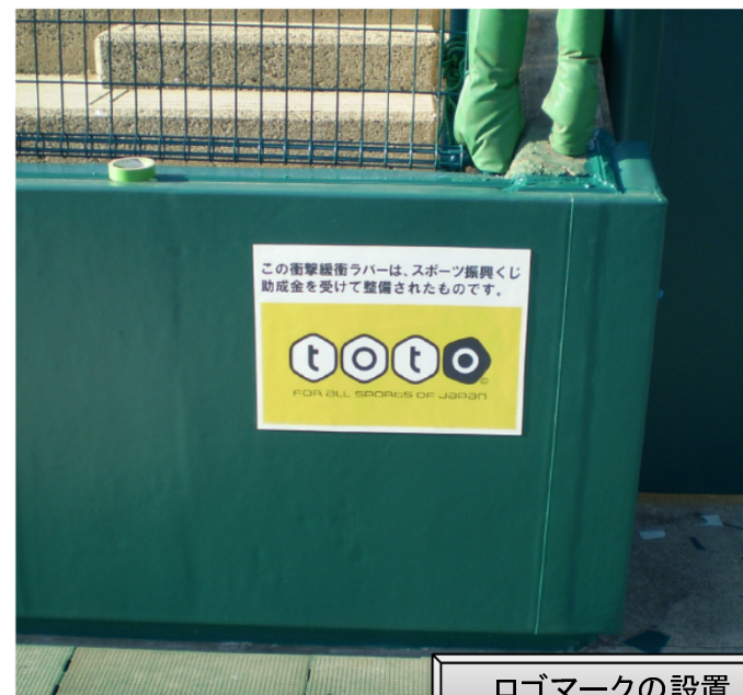
ロゴマークの設置