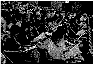
県民会議の資料に目を通す関係者