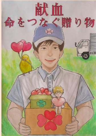
令和5年度特選作品