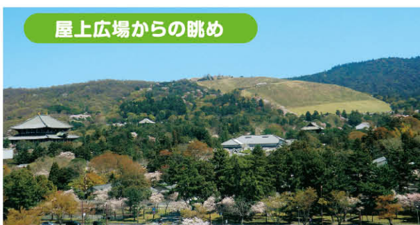
屋上広場からの眺め

ぜひ、玄関ホールに立ち寄って観光情報等を手に取り、奈良公園や屋上広場へお越しください。