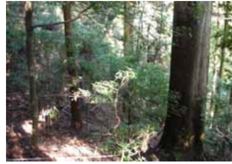
スギ大径木と広葉樹が混交する森林（春日山原始林内）

(1) 適切な管理・育成の考え方 春日山原始林の緩衝帯機能及び奈良公園の風致・景観の向上 スギ・ヒノキ大径木と照葉樹を中心とした広葉樹の混交林へと誘導することにより、以下の機能の更なる強化を図る。 春日山原始林を風倒被害等から守る緩衝帯としての機能。 春日山原始林と一体となって奈良公園の風致・景観を高める機能。 木造建造物文化財の修理資材となる高品質大径材の育成 将来の木造建造物文化財の修理資材を確保するために、200～300年生以上の高品質なスギ・ヒノキ大径木を育成する。 保育作業の実施体制の確立 保育作業には高度な技術が必要であることから、人材育成を図るとともに、保育作業を確実に実施できるよう財源を確保する。 (2) 利活用の考え方 文化財修理用の高品質大径材の生産 文化財修理に使用できる大径木にまで成長した段階で、文化財修理用木材として利用する。 檜皮の採取 副産物として檜皮を採取し、文化財修理資材として供給する。 育成過程で生産される森林資源の利用 高品質大径木を育成する過程で抜き伐りにより生産される材を有効活用する。 公園的利用の促進 都市公園奈良公園として、環境教育等のレクリエーション利用を促進するとともに、維持管理に係るボランティアを含む多様な主体の参画を図る。