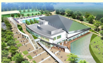
スイムピア奈良（イメージ）