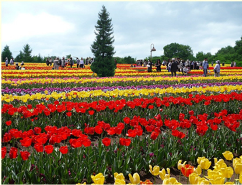
馬見丘陵公園（イメージ）