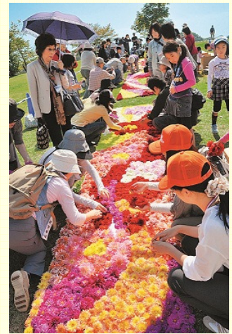
馬見フラワーフェスタ

○環境と共存する持続可能で健全な水循環の構築に向け、県内の水資源の実態を把握し、「保水力の向上」、「水利用の適正化」、「水辺環境の保全」の観点で総合的に検討を進めます。