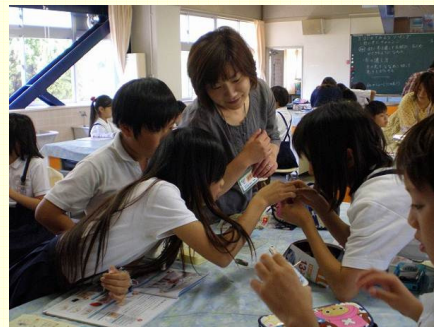
地域ボランティアの協力で家庭科の実習 (地域教育力推進モデル校)

○県立大学において、これからの地域社会を担う、自尊自立のたくましい人材を育成するため、対話型少人数教育や就業力、起業力を高める実践型教育を導入するなど、大学教育改革に取り組みます。