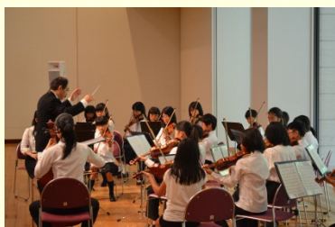
県立ジュニアオーケストラ