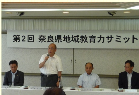
奈良県地域教育力サミット