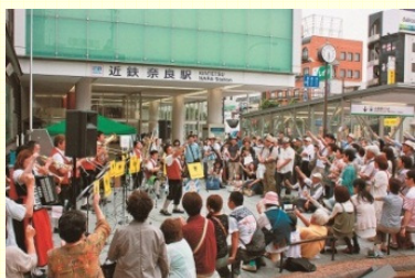
ムジークフェストなら2012