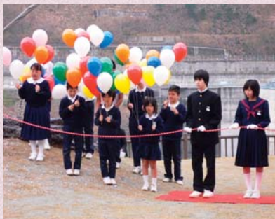
小・中学生による風船放天